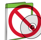
Jeux ou DVD