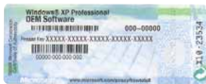
Certyfikat Autentyczności oprogramowania Microsoft Windows XP OEM

Certyfikat Autentyczności pomaga stwierdzić, czy oprogramowanie firmy Microsoft jest oryginalne. Certyfikat Autentyczności zawiera pasek holograficzny, na którym pojawiają się słowa „Microsoft” oraz „Genuine”. Nazwa produktu oraz unikatowy klucz produktu znajdują się pośrodku etykiety, a adres www.howtotell.com widnieje u dołu etykiety. Certyfikatu Autentyczności nie wolno usuwać ani przenosić na inny sprzęt.