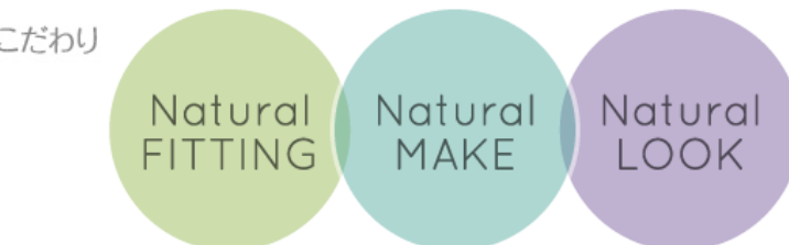
大連保税区摩達国际贸易有限公司

登録商標取得 3D Inner Wear Series 3次元設計で美しいナチュラルボディへ