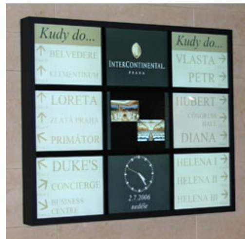
Vzhled Microsoft InfoPanels