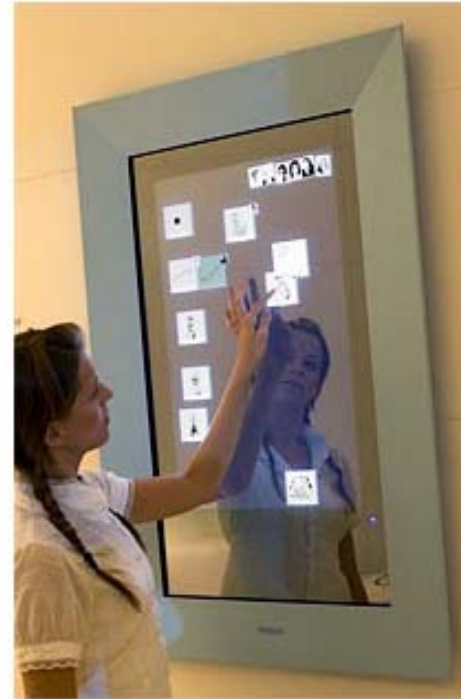
Philips Touch Wall