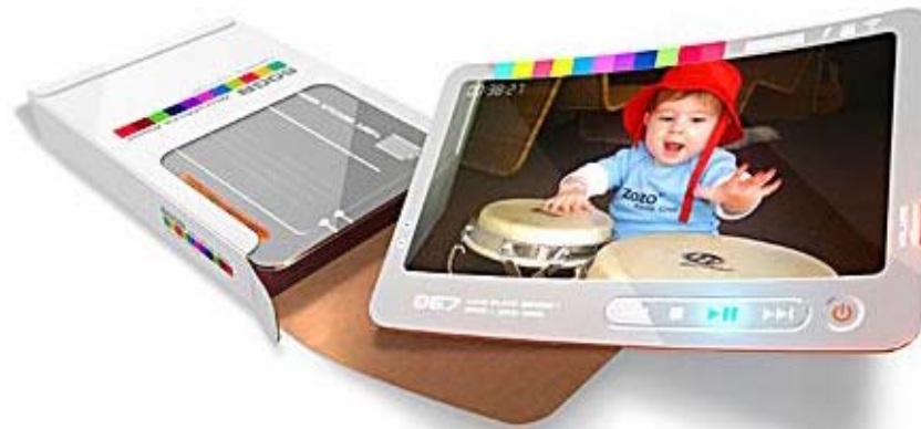
Micro media Electronics Paper (Lunar Design)

디스플레이 와 인터페이스 로 축약되는 미래UX 환경 은 디지털 미디어 크리에이티브에 획기적인 전환점 이 되고 있습니다