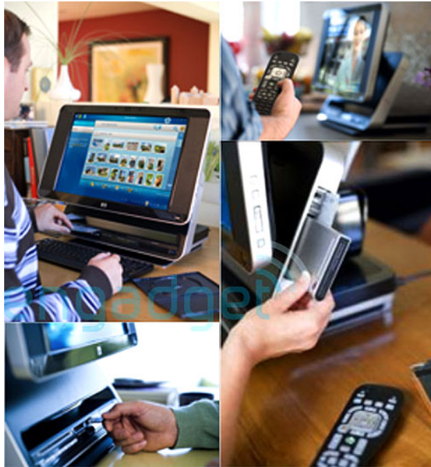
Touch Screen Window Vista PC

디지털 미디어 크리에이티브 관점에서는 인터넷과 접목된 데스크톱 환경과 디지털 TV, 셋톱, 휴대폰, 임베디드 디바이스들이 범람할 미래에 응용 프로그램의 생산과 유통을 책임질 플랫폼을 누가 장악할 것인가가 최대 관심 사항입니다