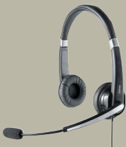
JABRA UC VOICE™ 550

ALLE 3.350 MITARBEITER TELEFONIEREN MIT JABRA-HEADSETS. DIE ÜBERWIEGENDE MEHRHEIT NUTZT DAS SCHNURGEBUNDENE JABRA UC VOICE™ 550, DANEBEN KOMMEN DAS BLUETOOTH®-HEADSET JABRA SUPREME UC SOWIE DIE USB-FREISPRECHLÖSUNG JABRA SPEAK™ 410 ZUM EINSATZ