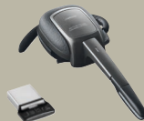
JABRA SUPREME™ UC