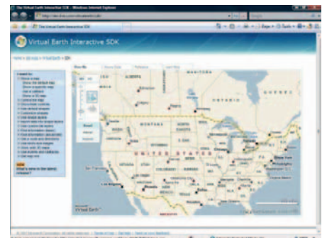
Virtual Earth SDK

Nutzen Sie eine .NET-basierte Geometriebibliothek, die OGC-Standards unterstützt. Erstellen Sie Anwendungen, die Geodaten verwenden und verändern. Nehmen Sie eine Integration in Standortdienste wie zum Beispiel Microsoft Virtual Earth™ vor, um umfangreiche standortfähige Lösungen zu erstellen, die Ihre Geodaten anzeigen.