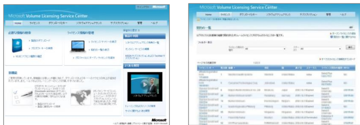
「ボリューム ライセンス サービス センター」 Web サイト

ライセンス管理者の方は、専用の Web サイト「ボリューム ライセンス サービス センター」にアクセスすることで、ボリューム ライセンスに関する情報および契約一覧や購入履歴の確認、ボリューム ライセンス プロダクト キーの表示と製品のダウンロード、ソフトウェア アシユアランス特典の有効化など、ボリューム ライセンスに関する作業を一元管理することができます。