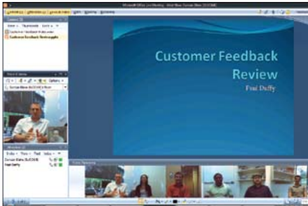
La misma experiencia es ofrecida a través de una consola común en Office Communications Server 2007 y en Office Live Meeting service. Esta pantalla muestra una reunión panorámica de video.