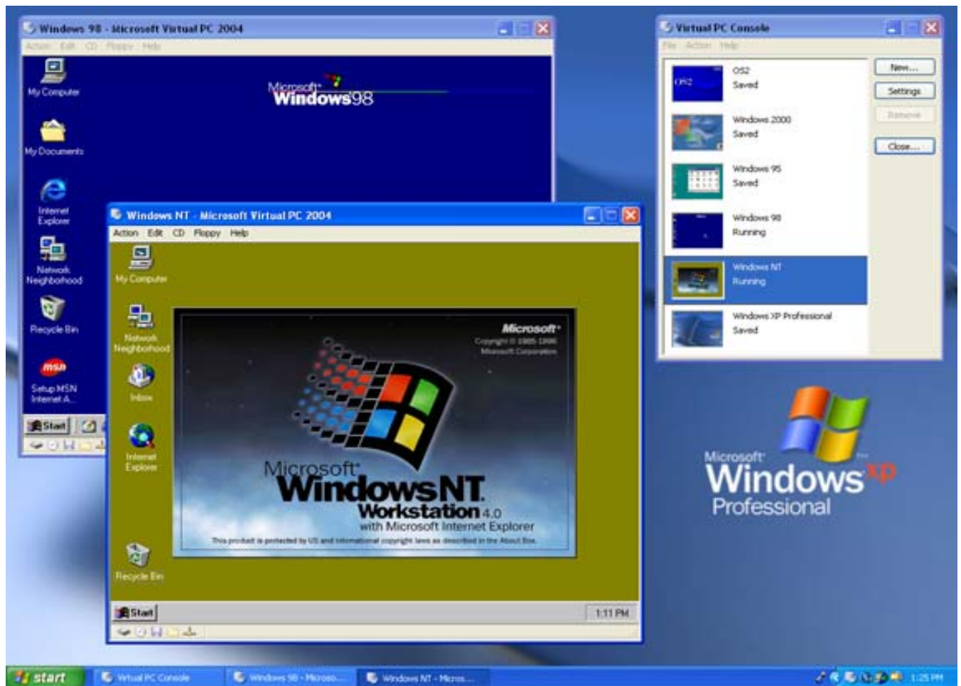
Abbildung 1. Windows NT® Workstation 4.0 und Windows 98 als Gastbetriebssysteme in Windows XP

Jede virtuelle Maschine verhält sich wie ein Computer mit eigener Audio-, Video- und Netzwerkkarte und eigenem Prozessor. Auf jeder virtuellen Maschine läuft ihr eigenes Betriebssystem. Anwender können dabei jedes x86-Betriebssystem installieren und betreiben. Folgende Betriebssysteme werden auf Virtual PC von Microsoft voll unterstützt: Windows 95, Windows 98, Windows Me, Windows NT 4.0 Workstation, Windows 2000 Professional, Windows XP, MS-DOS®, OS/2 Warp Version 4 Fix Pack 15, OS/2 Warp Convenience Pack 1 und OS/2 Warp Convenience Pack 2.